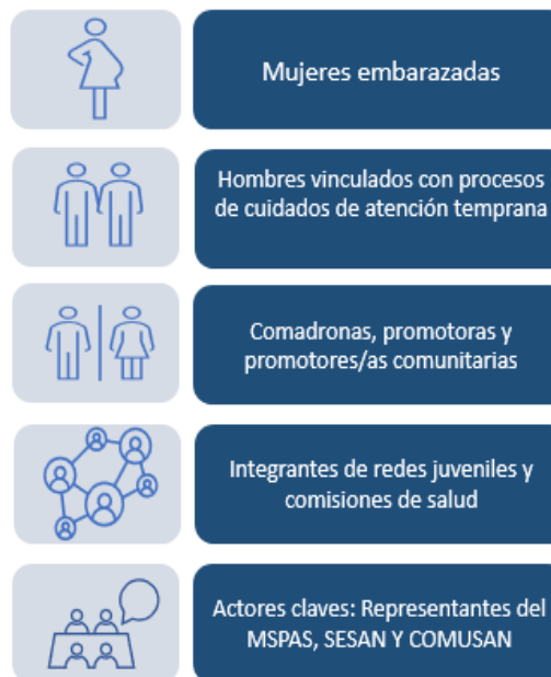
Figura 2 Actores claves para el trabajo de campo

Para desarrollar el trabajo de campo, se realizaron con Ayuda en Acción las coordinaciones pertinentes en cada región con cada uno de los puntos focales y responsables del proyecto “Niño Sano”, quienes apoyaron en el proceso de convocatorias en las comunidades definidas en el plan de acción y con base a la muestra establecida inicialmente por tipo de actor. Las acciones de campo se realizaron del 24 de junio al 15 de julio, asimismo todas las actividades de campo estuvieron acompañadas por el equipo de Ayuda en Acción en los territorios. El total de ejercicios realizados se presentan en la siguiente tabla.