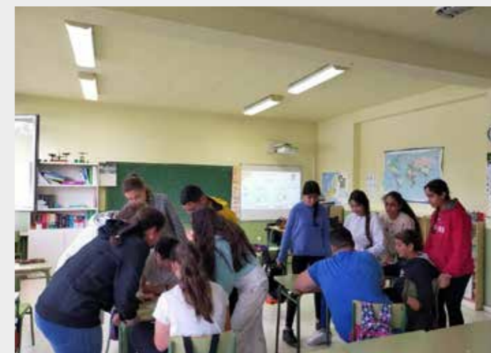
Talleres competencias digitales CP Pablo Iglesias (Soto de Ribera).