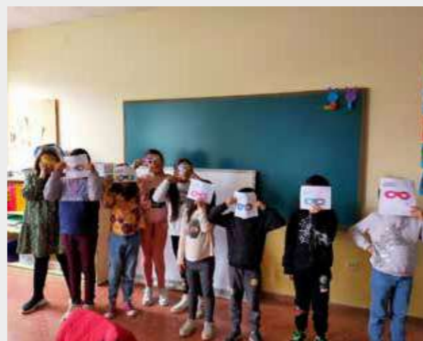
Talleres de CME en CP Virgen de las Mareas (Avilés).

Con el lema “TransformaT para convivir”, la Semana Mundial de Acción por la Educación (SAME) el objetivo de 2024 puso la reflexión sobre los discursos de odio, la aceptación de las diferencias y la resolución de conflictos, a través de educación enfocada en equipar y capacitar a toda la comunidad educativa -alumnado, profesorado, familias, ciudadanía en general y responsables políticos- para ser capaces de examinar, cuestionar y cambiar las construcciones sociales y culturales.