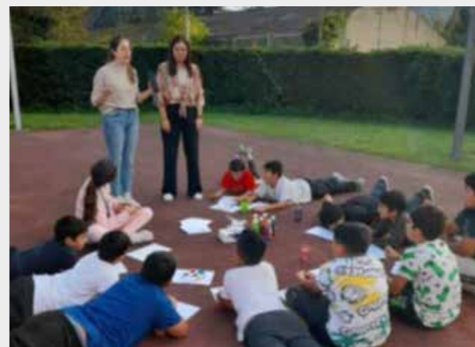
Actividad de refuerzo educativo en Ferreros (Ribera de Arriba).

Dentro de esta línea de trabajo, hemos promovido espacios de: refuerzo educativo para el alumnado en horario extraescolar, escuela de familias, talleres de gestión de emociones, promoción de comunidades de aprendizaje (tertulias dialógicas, grupos interactivos), proyectos biblioteca, apoyo transición de etapas educativas, apoyos en la creación de planes de digitalización y coeducación, servicio de comedor escolar, refuerzo de competencias digitales del alumnado, etc. Algunos de los proyectos desarrollados han sido: "Fortaleciendo competencias para la inclusión educativa" que permitieron elaborar tres guías metodológicas en colaboración con otros territorios, denominadas: "Servicio de Competencias Clave para Familias", "Guía para el desarrollo de un servicio de refuerzo educativo escolar desde el apoyo a la acción tutorial" y "Capacitación y convivencia digital".