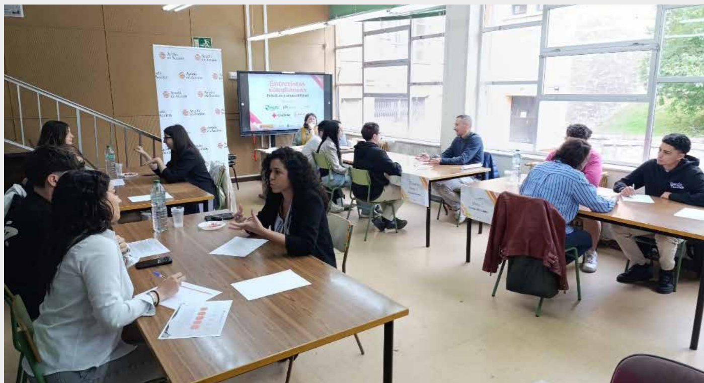
Jornada proyecto Impulsa en el CIFP de Avilés.