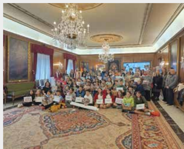
Acto central Día Ciudades Educadoras Ayuntamiento Avilés.

Durante 2024 continuamos trabajando en plataformas y redes regionales como: la Coordinadora Asturiana de ONGD (CODOPA) Campaña Mundial por la Educación, EAPN-Asturias, Consejo de infancia de la Mancomunidad Comarca de la Sidra.