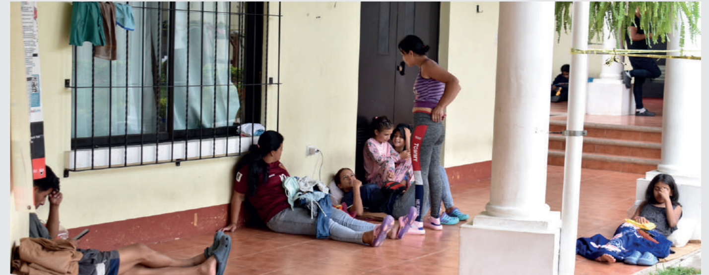
Mujeres migrantes en espacio humanitario en Guatemala

Desde del año 2020 ayuda en Acción Euskadi ha estado implementando un programa de apoyo a personas en MHF en fronteras de México, que fue ampliado en 2023 a Guatemala.