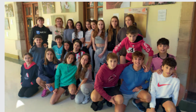
Visita guiada con alumnado de 3º de la ESO del Colegio Santa María de Portugalete.