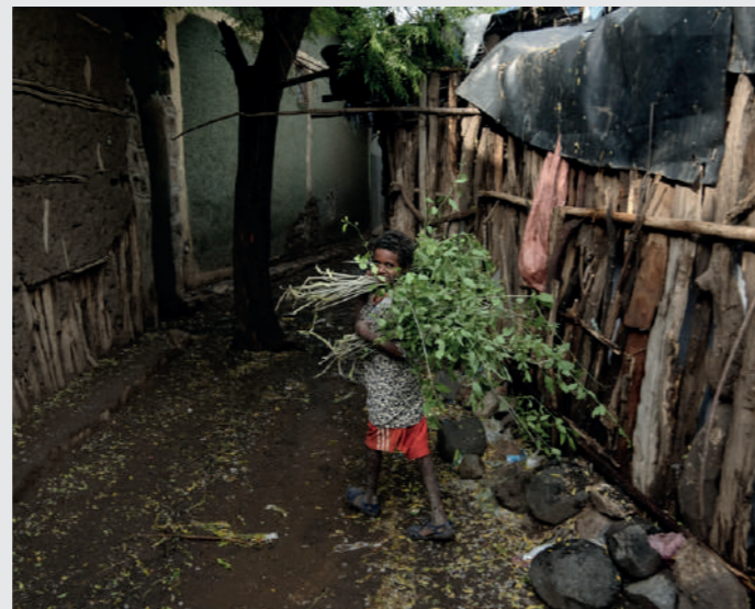
Niño transportando ramas para su hogar, una imagen habitual de la infancia en Etiopía.