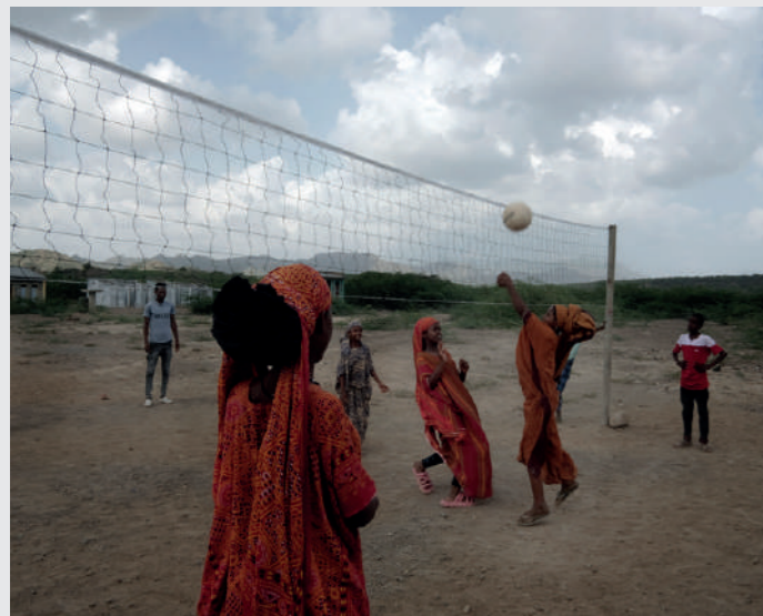
Niñas de escuela de Afar jugando voleibol como apoyo del proyecto a actividades educativas

El trabajo que impulsamos en la región está siendo apoyado por la Agencia Vasca de Cooperación y Solidaridad (AVCS) y la Diputación Foral de Bizkaia (DFBizkaia), desde el año 2023 con 480 000 €.