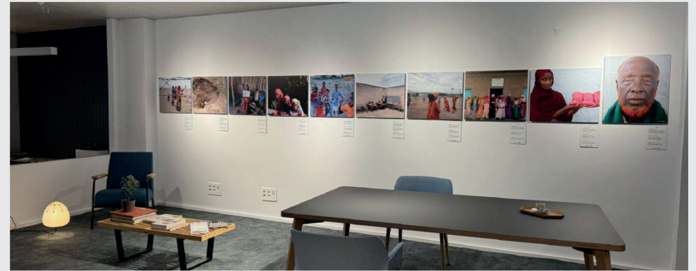
Exposición fotográfica en Espacio Icaza, Bilbao.

Seguidamente, fue expuesta en el hall del edificio de la comercial de la Universidad de Deusto en Bilbao, entre el 18 y el 26 de noviembre.