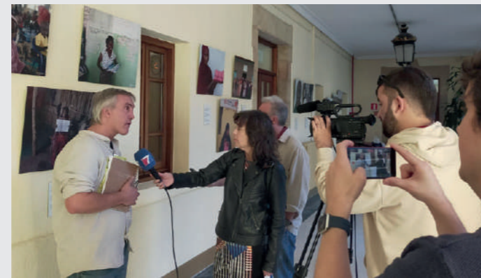
Rueda de prensa presentación de la exposición en Portugalete

Igualmente, la exposición estuvo abierta al público general y difundido por Ayuda en Acción y por el municipio en sus redes sociales y en las pantallas digitales físicas disponibles en diferentes puntos de la localidad.