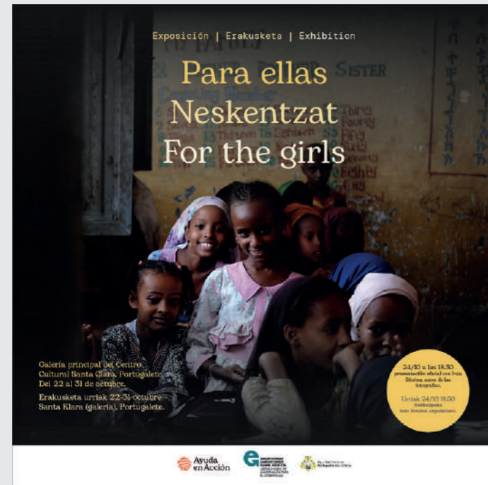
Cartel presentación de la exposición.

La presentación oficial de la exposición se llevó a cabo el 28 de octubre en el Centro Cívico Santa