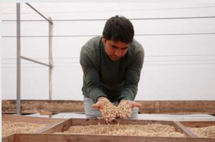
Productor de café

El proyecto se articulará en torno a los siguientes ejes de acción: 1) Producción sostenible, certificación orgánica y regeneración de ecosistemas; 2) Innovación para reducir, reutilizar y reciclar; 3) Mejorar el acopio, la transformación y la comercialización con visión empresarial; 4) Gobernanza con equidad de género; 5) Incidencia política y consumo responsable.