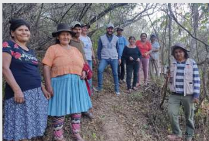
Personal del proyecto de Ayuda en Acción, de la entidad Social Local NorSud y Apicultores/as