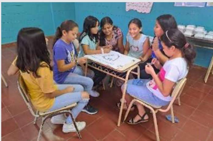
Reunión de comité infantil

- El fortalecimiento de los actores del Sistema Integral de Protección con capacitaciones y metodologías para la implementación planes y programas con estándares de protección basados en los DDHH de infancia y adolescencia con perspectiva de género.