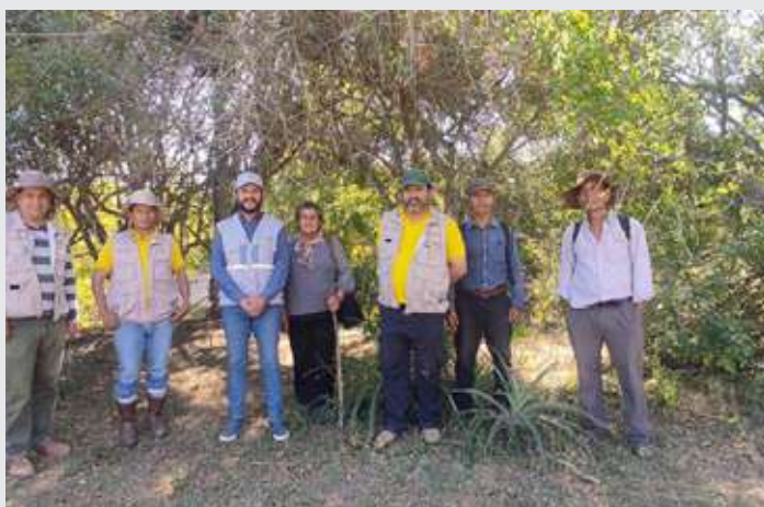
Personal del proyecto de Ayuda en Acción, de la entidad Social Local NorSud y Apicultores/as

El proyecto se ejecutó junto a la entidad social local Fundación Intercultural NOR SUD.