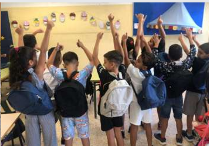
Donación de Amazon para la vuelta al cole