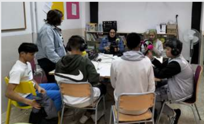
Radio escolar: IES Las Lomas

El proyecto se ha desarrollado en los centros educativos CEIP Gloria Fuertes, CEIP Monte Benacantil y CEIP Santísima Faz, con la participación de 64 chicas y 60 chicos . La iniciativa tiene como eje la radio escolar como herramienta de aprendizaje, expresión y transformación social, fomentando la participación activa del alumnado y su sensibilización en torno a los Objetivos de Desarrollo Sostenible (ODS) . Para ello, se ha creado un banco de recursos pedagógicos sobre radio y participación infantil, se han impartido talleres de formación para alumnado y profesorado