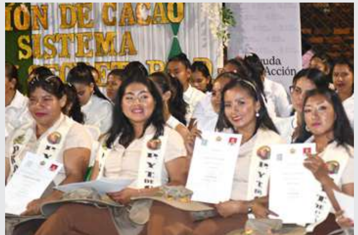
Entrega de certificados de formación a profesorado participante del proyecto