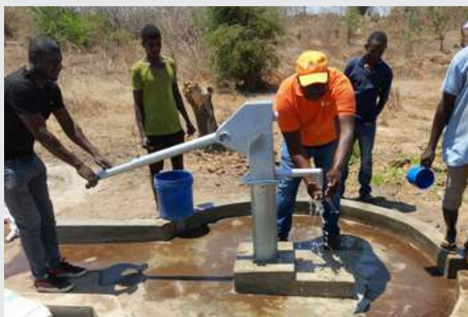
Rehabilitación de pozos en zonas de reasentamiento de DPIs