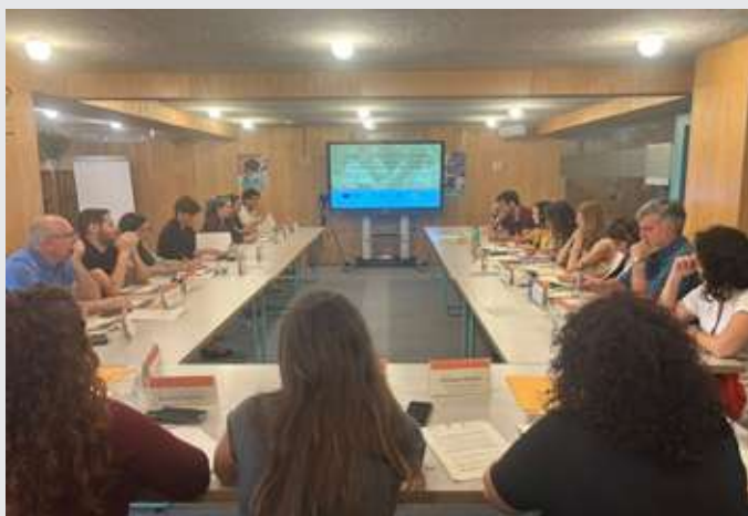
Jornada de innovación educativa Continuing is Winning (proyecto Erasmus+)

En 2024, Ayuda en Acción finalizó la ejecución de este proyecto europeo, desarrollado en el marco del programa Erasmus+ en alianza con la Fundación italiana l'Albero della Vita. La iniciativa tuvo una duración de 15 meses y se centró en la prevención del abandono escolar temprano , con especial atención al momento crítico de la transición entre primaria y secundaria , etapa en la que se incrementa el riesgo de fracaso y abandono escolar en alumnado en situación de vulnerabilidad.