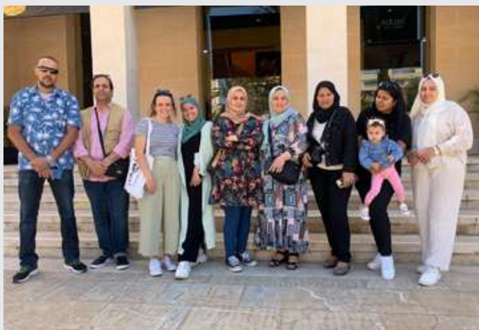
Visita al MARQ servicio de formación de competencias clave para familias

2. Por otro lado, se ha desarrollado el servicio de formación en competencias clave para el aprendizaje permanente de las familias , cuyo propósito es promover la implicación activa de las familias en el proceso educativo de sus hijos e hijas. Para ello, se ofrece formación en competencias básicas y digitales, a través de metodologías presenciales y online, con el fin de reducir la brecha digital y favorecer la participación inclusiva. La implementación del Diseño Universal para el Aprendizaje (DUA) ha permitido adaptar las actividades a la diversidad de capacidades y necesidades del entorno escolar.