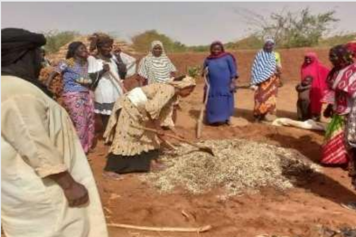
Capacitación en técnicas agrícolas

La reducción de los casos de malnutrición aguda moderada (MAM), con foco en los grupos con mayor vulnerabilidad (primera infancia y mujeres embarazadas, lactantes y en edad fértil), el incremento de la producción agrícola, la innovación aplicada a la nutrición, la formación de mujeres y niñas en torno a sus derechos, el fortalecimiento de capacidades de titulares de obligaciones para un mejor ejercicio de sus competencias, y la sensibilización masiva de las comunidades han sido claves para lograr estos objetivos.