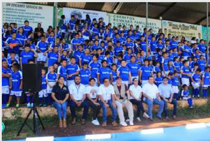
Campeonato de escuelas sociodeportivas