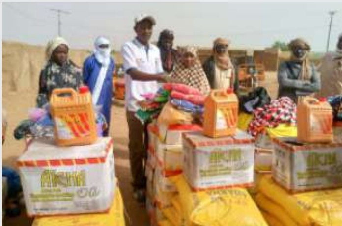
Entrega de insumos agrícolas

Concretamente el proyecto promueve el fortalecimiento de capacidades a distintos niveles para incrementar la seguridad alimentaria y nutricional, a través de la detección de casos de malnutrición, con foco en los grupos en situación de mayor vulnerabilidad (primera infancia y mujeres embarazadas, lactantes y en edad fértil); la facilitación del acceso a alimentos fortificados; y el apoyo a una producción sostenible y resiliente de alimentos. Además, a nivel agrícola el proyecto propone acciones tales como la utilización de técnicas agroecológicas e insumos adaptados al cambio climático y, a nivel pastoral, el apoyo a la cría de pequeños rumiantes, común entre las mujeres de la población de acogida y desplazada.