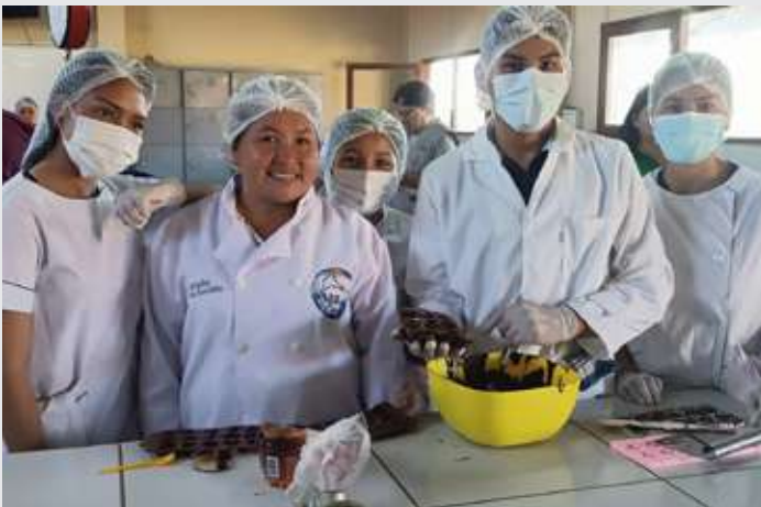
Alumnas y alumnos de la carrera de cacao en la Amazonia Boliviana

El proyecto se está ejecutando junto a la entidad social local Fundación Intercultural NOR SUD y ACLO.