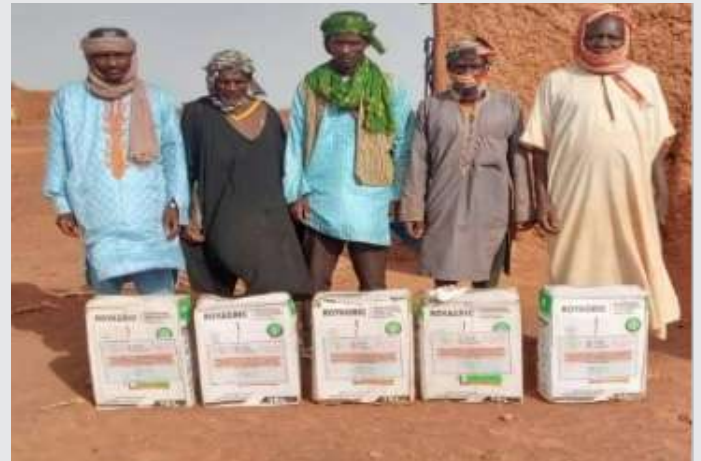
Entrega de insumos agrícolas