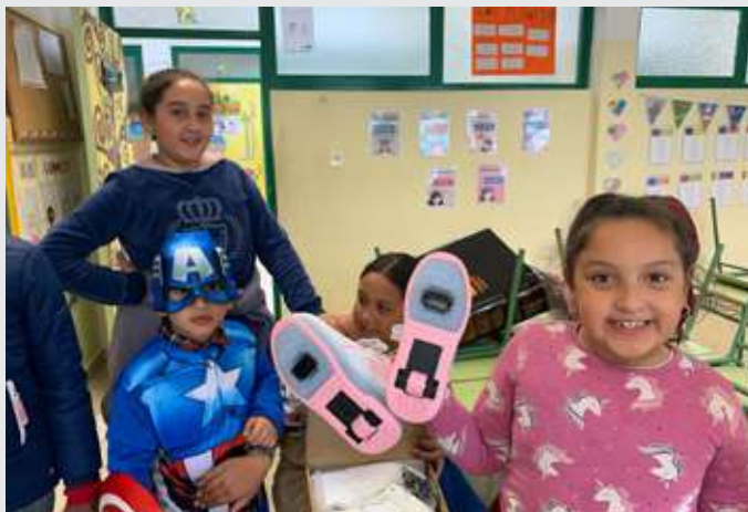
Donación Arbol de los Sueños de Caixa Proinfancia

En paralelo, como entidad, formamos parte de la red de Caixa Proinfancia en Alicante , desde donde prestamos servicios de atención psicoterapéutica y de refuerzo escolar a niños, niñas y adolescentes en situación de vulnerabilidad. Este trabajo complementa la estrategia del programa al ofrecer un acompañamiento