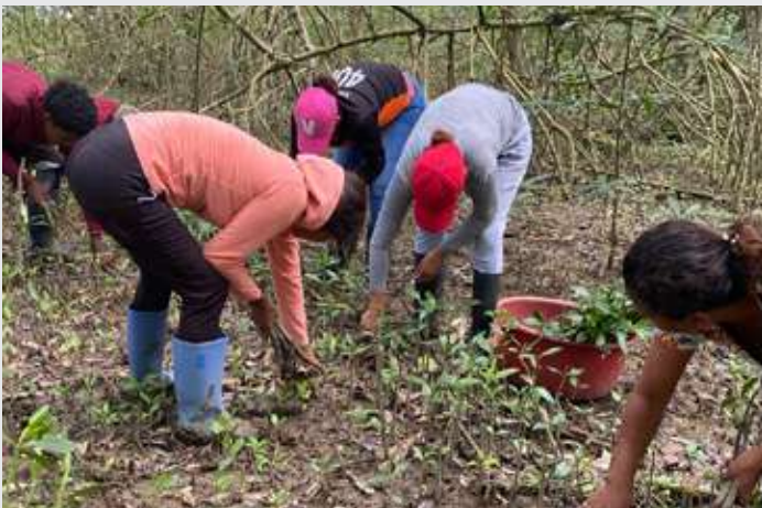
Actividad de reforestación de manglar

El proyecto se está ejecutando junto a la entidad social Corporación Esmeraldeña para el fomento y Desarrollo Integral (CEFODI).