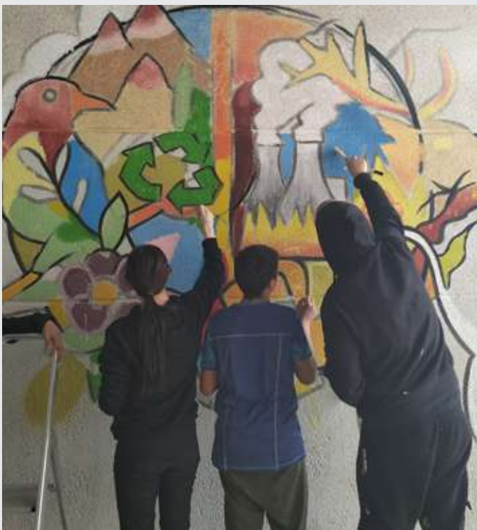
Taller de Grafiti en el IES Malilla de Valencia

Entre sus actividades destacan los talleres de sensibilización, concursos de campañas digitales, grafitis y teatro de calle como formas de activismo, conversatorios entre jóvenes de la Comunitat y de El Salvador, así como la creación del grupo de trabajo "YouthinMotion" para diseñar y liderar acciones de sensibilización e incidencia.