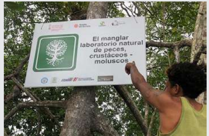
Señalética para la protección y delimitación del uso del manglar