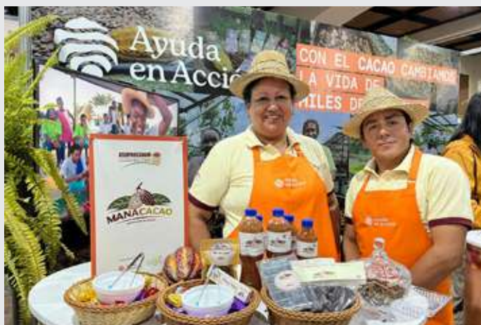
Productores de cacao