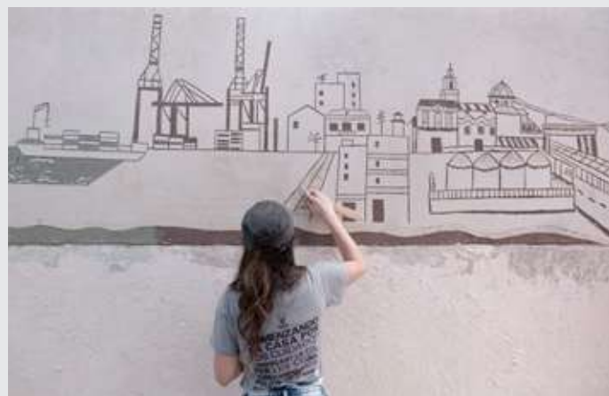
Mural colaborativo con la asociación de vecinos del barrio de Nazaret en Valencia

El objetivo ha sido potenciar el papel clave que tiene la juventud frente al ODS13 y nuestra capacidad de mitigación y adaptación, aumentando en la juventud su capacidad de propuesta y una ciudadanía activa.