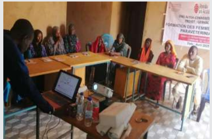
Capacitación a mujeres en técnicas agrícolas y veterinarias