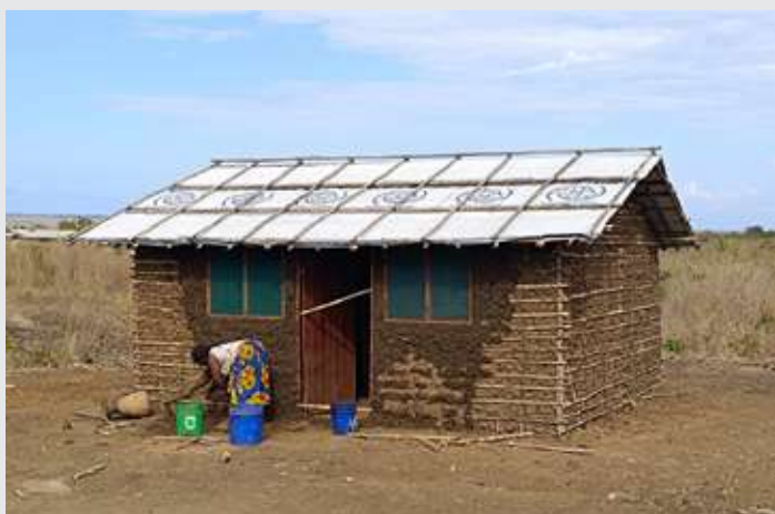
Construcción de abrigo a DPI

Para ello, en primer lugar, se está trabajando en la mejora de los niveles de protección de las poblaciones afectadas por el conflicto a través del acceso a refugios seguros y adaptados. En segundo lugar, se está trabajando en reducir el impacto de enfermedades de transmisión por el agua, a través de la mejora del acceso a bienes servicios e instalaciones de agua, saneamiento e higiene.