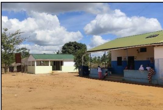
Dia4_Centro de Salud de Minheuene_Detalle nueva construcción (izda) junto al Centro de Salud