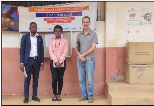
Dia2_Ancuabe_Encuentro SDSMAS con responsable de Brigadas Moviles y SDPI-fuentes de agua