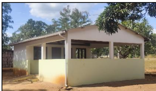
Dia4_Centro de Salud de Mariri_Detalle nueva construcción