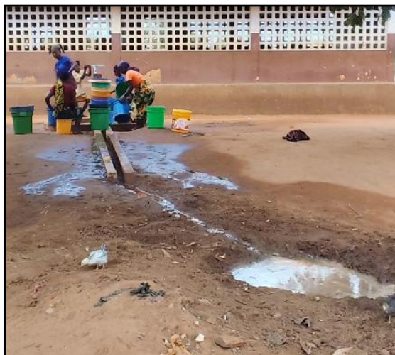
Dia3_Escuela de Muaja_Detalle drenaje aguas sobrantes y alrededores