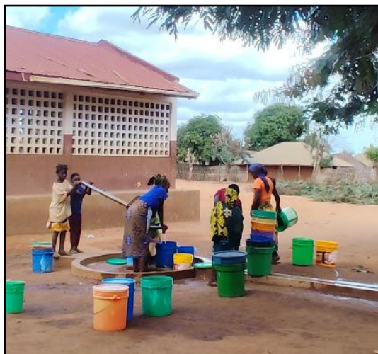
Dia3_Escuela de Muaja_Detalle salas de aula precarias Detalle furo en funcionamiento