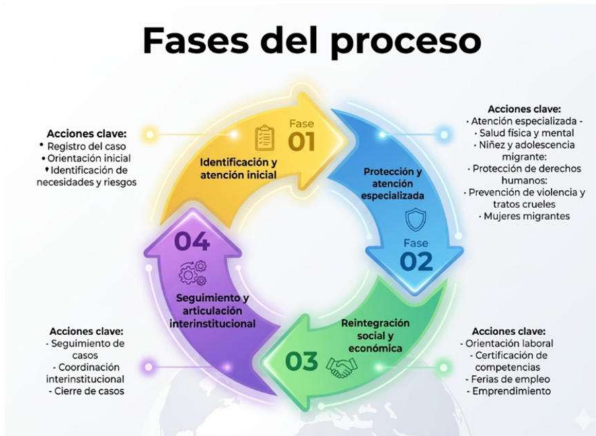
Imagen No. 3 Proceso de derivación en Huehuetenango.