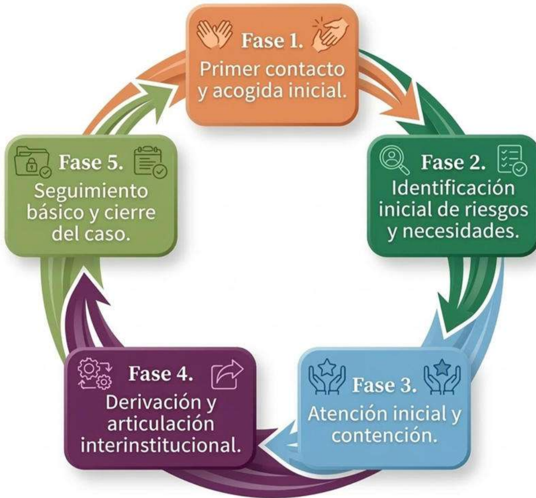
Imagen No. 1 Proceso de seguimiento de casos en Las Casas del Migrante de Tecun Umán y Esquipulas.